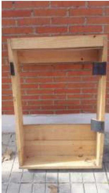
El antes y después de una mesa de cultivo

Aunque qué mejor manera para explicaros en que ha consistido este nuevo proyecto, que veáis algunas fotos de la evolución y transformación de una zona deshabilitada, en nuestro pequeño huerto urbano y futura zona verde.