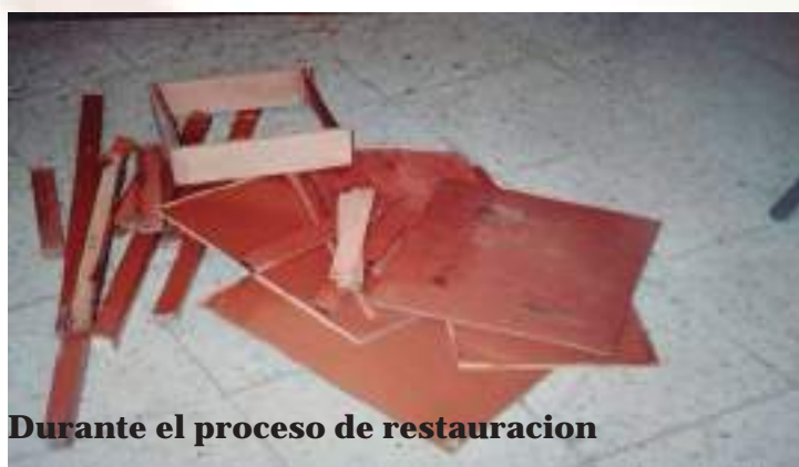
Durante el proceso de restauracion