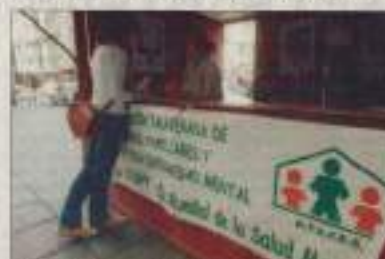
Atafes instalará un punto de información en la Trinidad.