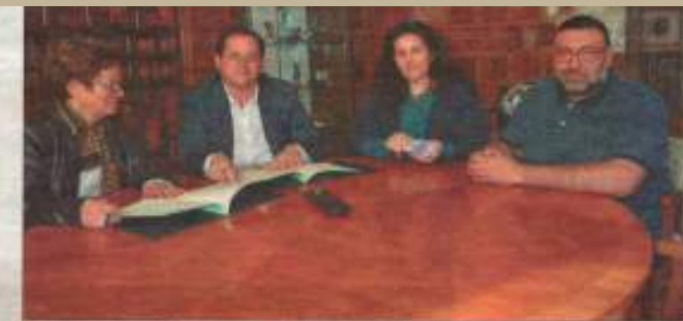
Tienda Villarriba junto a la presidenta de Atafes y trabajadores de la asociación, en la firma del convenio. | I

Después de la presencia de la presidenta de Atafes, reflexionó que bien sería poner énfasis al trabajo terapéutico. Page dijo que los tiempos más difíciles para las personas con enfermedad mental ya están pasando y el Plan Regional de Salud Mental 2015-2020 será el primer paso para mejorar la vida de las personas con enfermedad mental en Castilla-La Mancha.