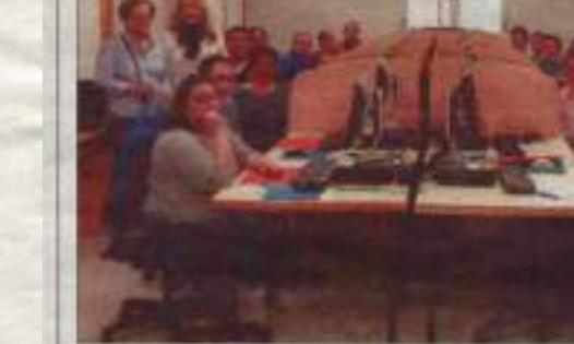
La Asociación conmemoró el Día Mundial de la Salud Mental pidiendo una igualdad real bajo el lema 'Soy como tú, aunque aún no lo sabes'