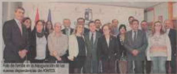
Foto de familia en la inauguración de las nuevas dependencias de ATAFES.

García-Piña ha subrayado que el Ejecutivo que preside va a llevar adelante el Plan de Salud Mental y que, al igual que otros departamentos, incorporará la creación de una Unidad de Medio Entorno en Talavera de la Reina esta legislatura.