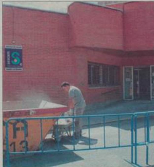
Un operario retira ayer escombros del antiguo centro de salud.