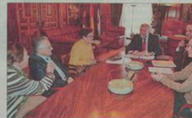
Un momento del encuentro de ayer, en Alcaldía.

«Llevamos dos años luchando y creo que nos queda muy poquito», recalcó Bonilla, quien dijo que en el encuentro de ayer recibieron esta buena noticia al confirmarse que se llevará a cabo esta cesión y