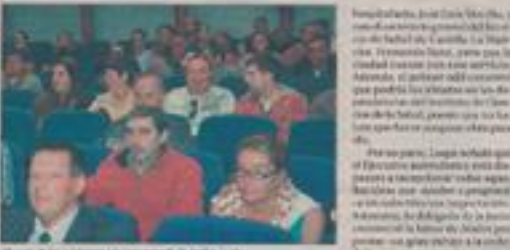
El alcalde aseguró ayer que ya ha planteado esta posibilidad tanto a la Gerencia del Hospital como al responsable del Setcam