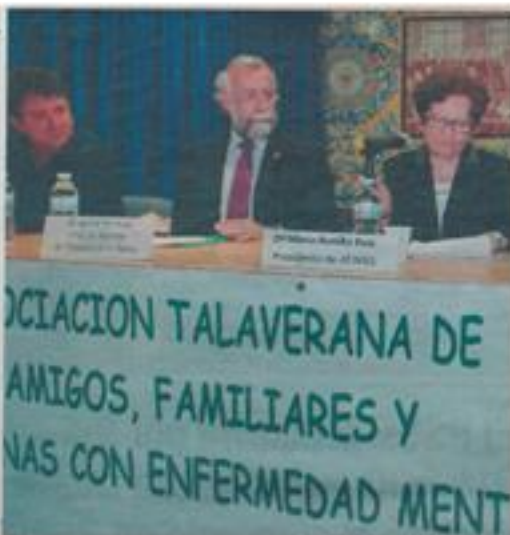
El alcalde aseguró ayer que ya ha planteado esta posibilidad tanto a la Gerencia del Hospital como al responsable del Setcam