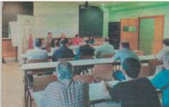
El alcalde aseguró ayer que ya ha planteado esta posibilidad tanto a la Gerencia del Hospital como al responsable del Setcam